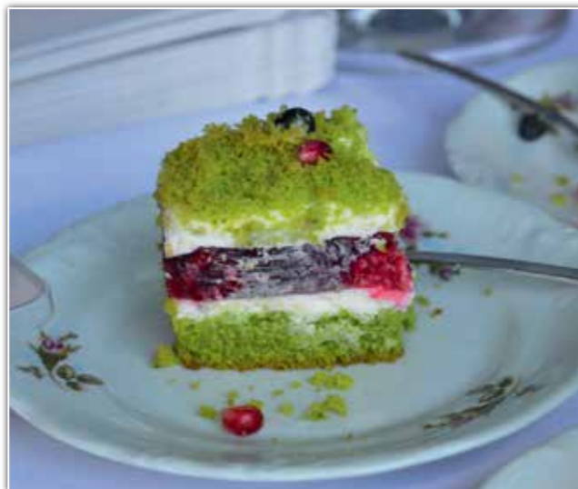
Ciasto leśny mech, poczęstunek na festynie.