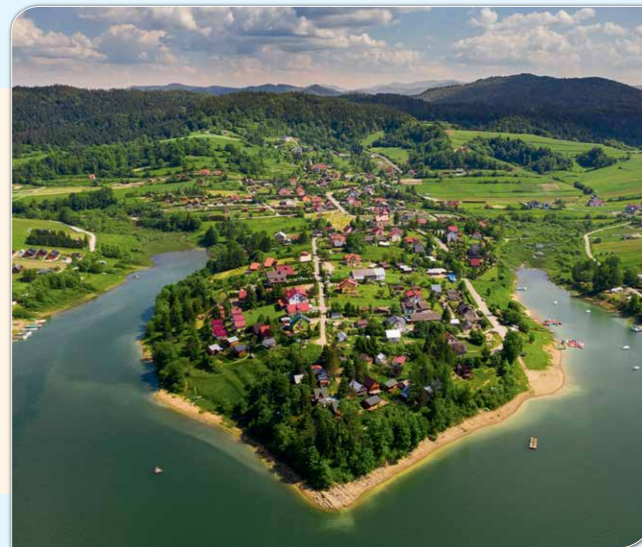
Widok na Zawóz.