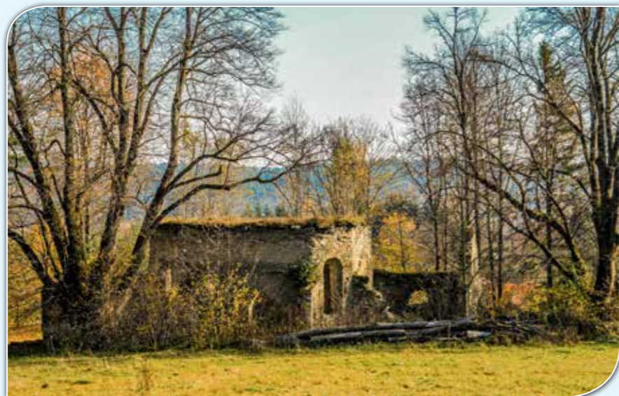
Ruiny cerkwi w Berezce.