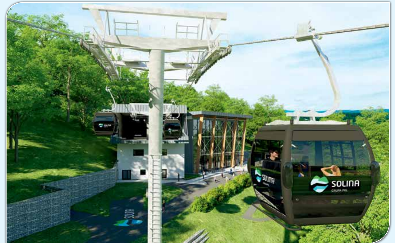
Kolej gondolowa nad Jeziorem Solińskim.