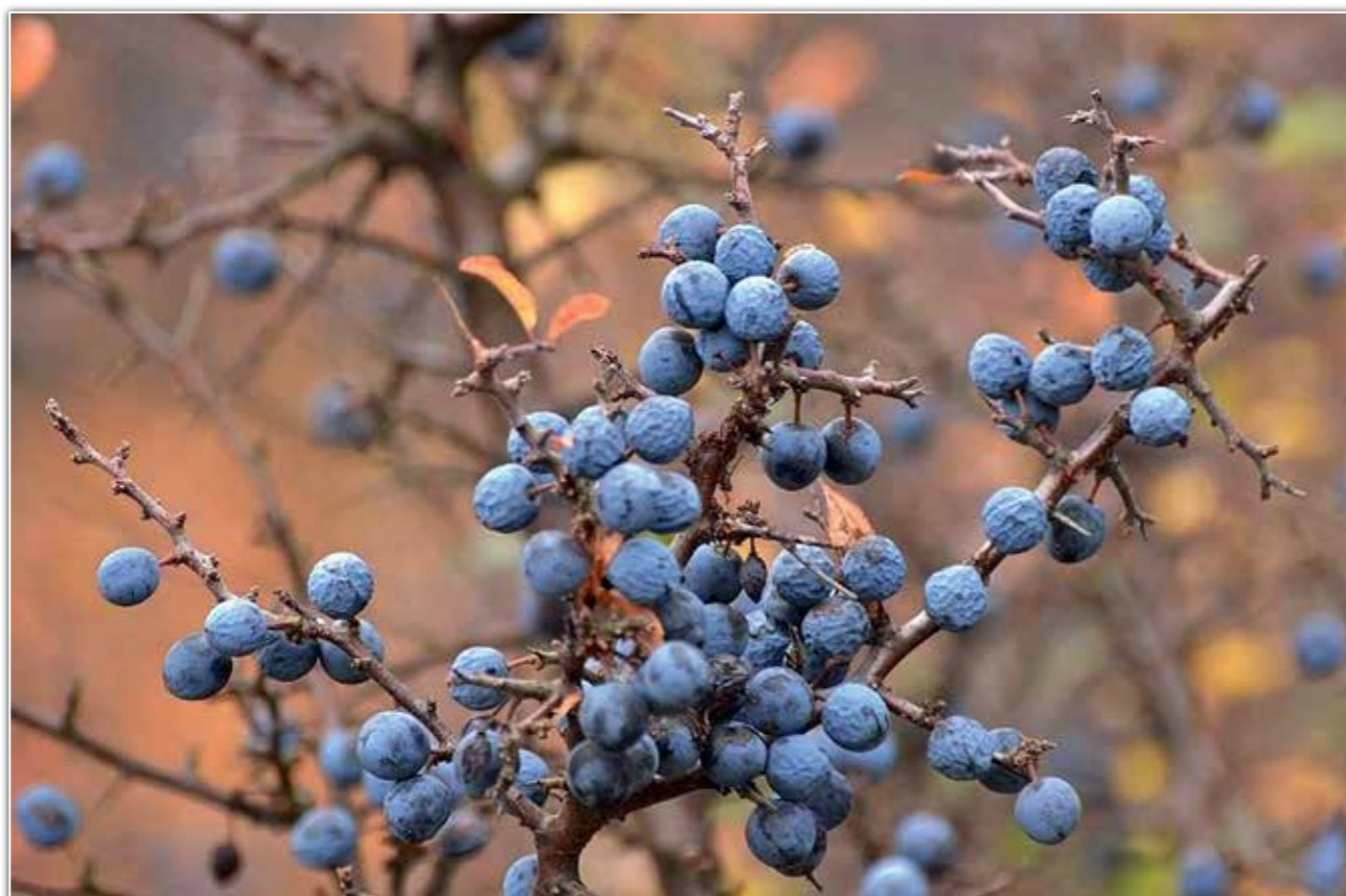
Owoce tarniny.