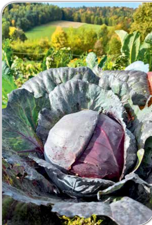
„Zawołoka” na bieszczadzkiej ziemi.