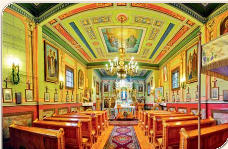
Wnętrze zabytkowego kościoła w Bereźnicy Wyżnej.