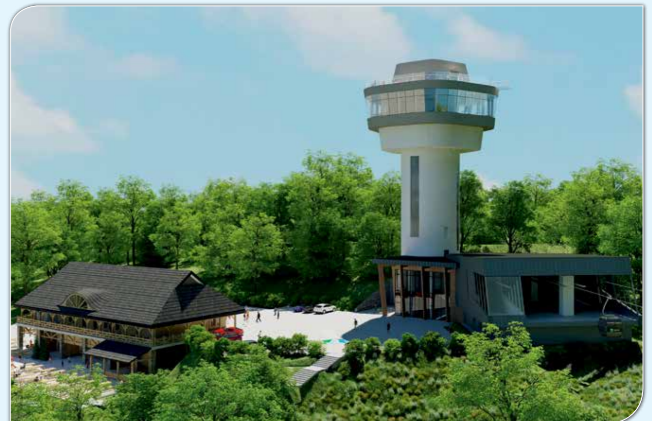
Kolej gondolowa nad Jeziorem Solińskim.