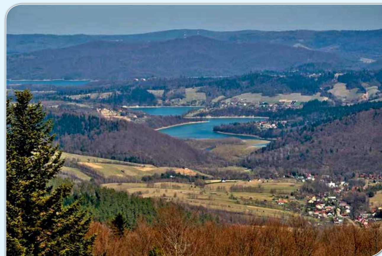
Widok na Bukowiec.