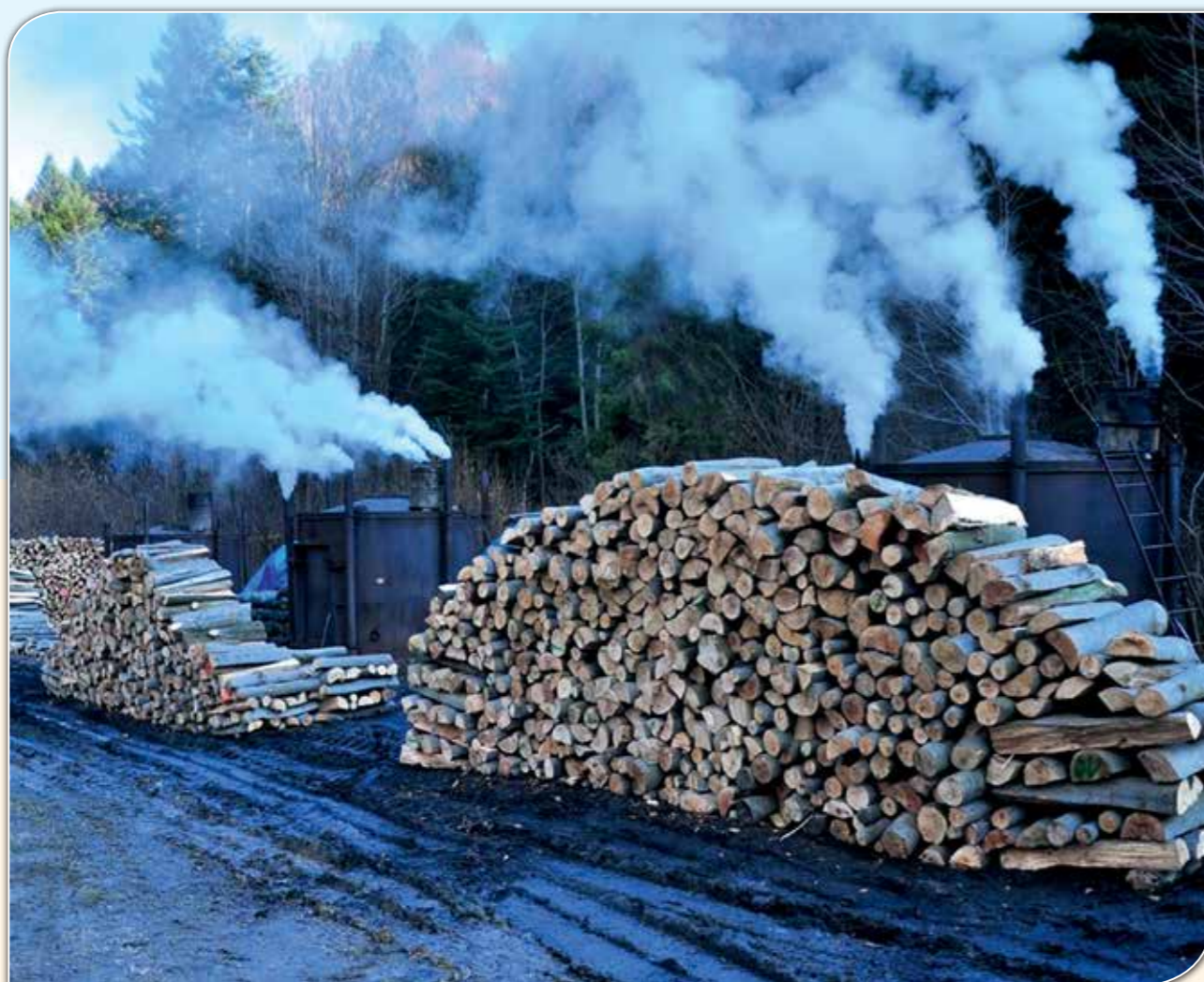
Gdzieś w bieszczadzkich lasach dymią jeszcze retorty do wypału węgla drzewnego.