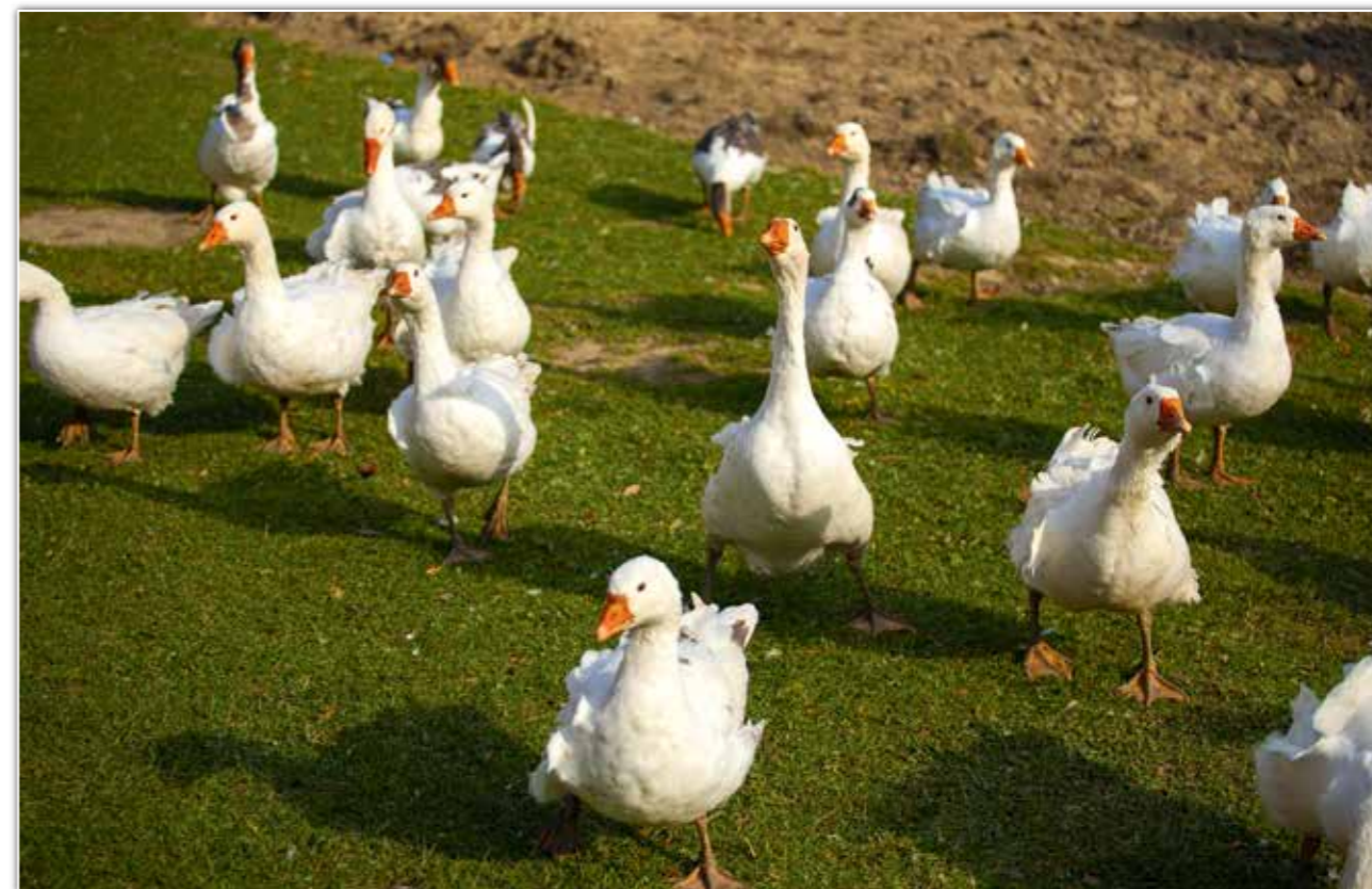
Stado gęsi na wolnym wybiegu, Bereźnica Wyzna.