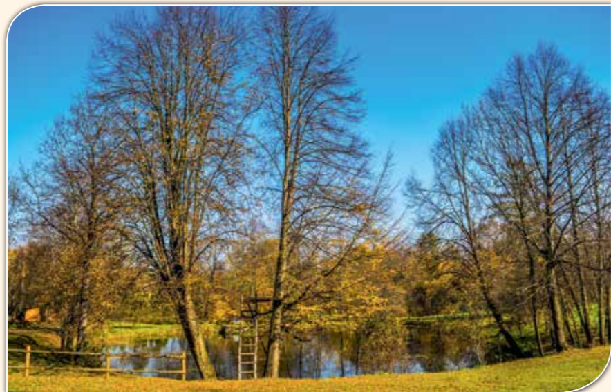
Park dworski, Berezka.