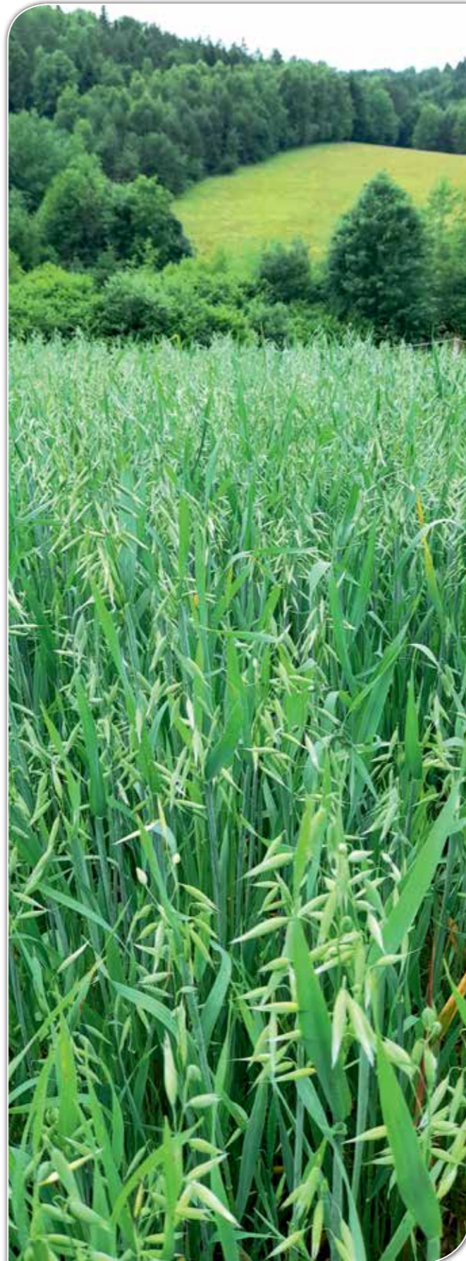
„Zasiali górale owies”, bo pszenica na tej ziemi nie urośnie.