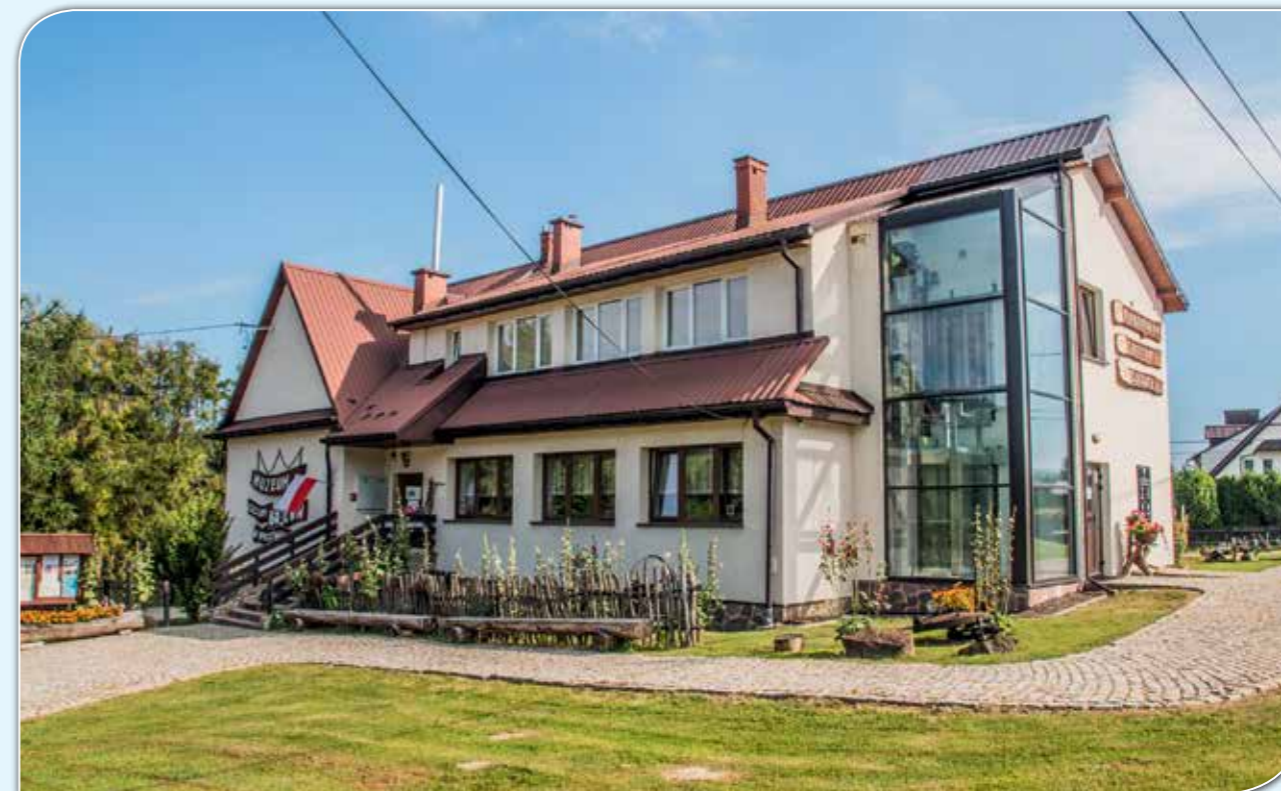
Gminne Muzeum Kultury Duchowej i Materialnej Bojków w Myczkowie.