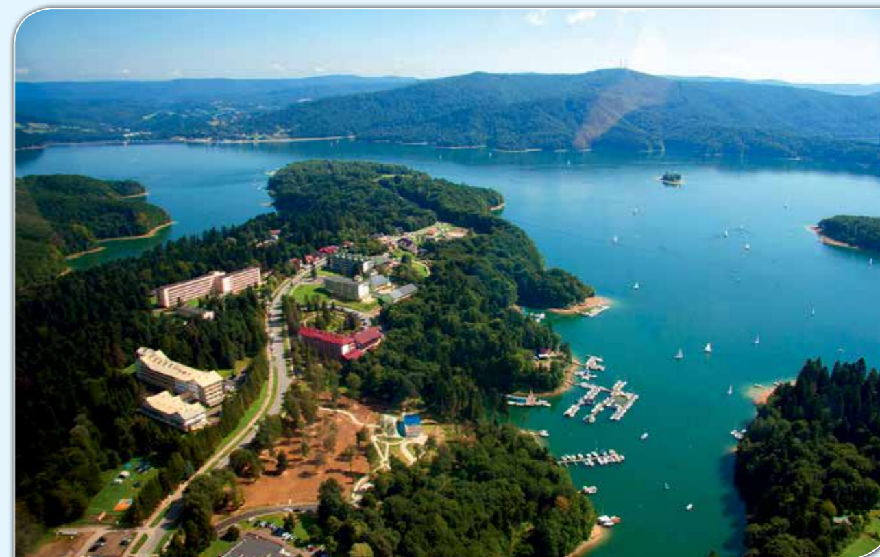
Uzdrowisko Polańczyk.

Drobno posiekane dwie cebule podsmażone na tłuszczu, do tego dodać 6 łyżek śmietany 18% i podsmażyć. Gotową omastą polewać gołąbki.