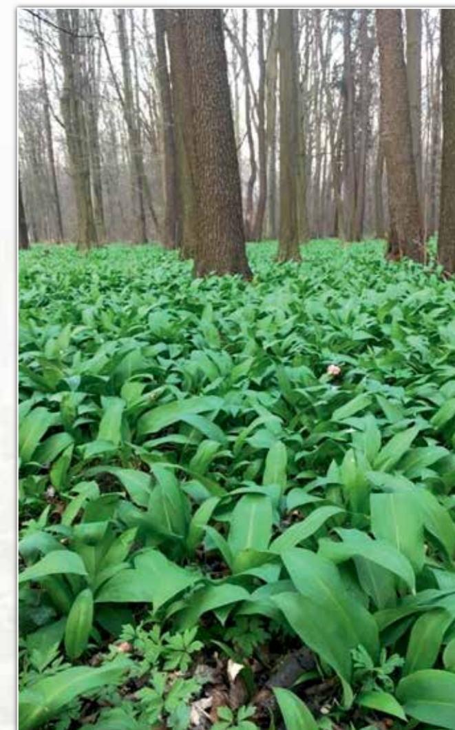
Czosnek niedźwiedzi.

„W Bieszczadach czosnek niedźwiedzi był zawsze ważnym źródłem wiosennego menu. Warzyło się na nim zupy i smażyło szpinaki. Liście były także kiszone i zaprawiane w soli. Czosnek niedźwiedzi służył też jako dodatek do potraw mięsnych i roślin strączkowych”. (A. Szary „Tajemnice bieszczadzskich ziół wczoraj i dziś”).