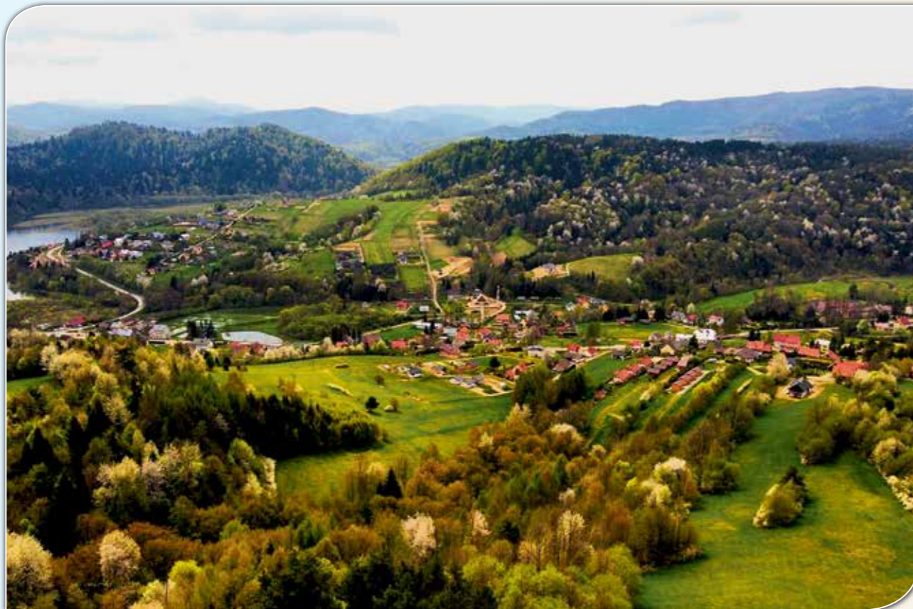
Widok na Wołkowyję.