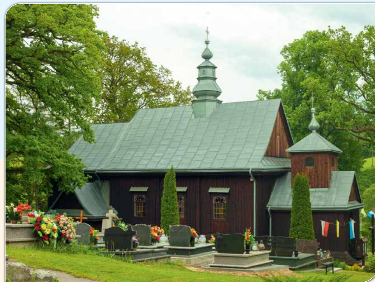
Zabytkowa świątynia w Górzance.

Koło Gospodyń Wiejskich zachęca do przyrządzania tego smacznego i zdrowego dla naszych jelit napoju, zamiast sztucznie barwionych i aromatyzowanych napojów gazowanych.