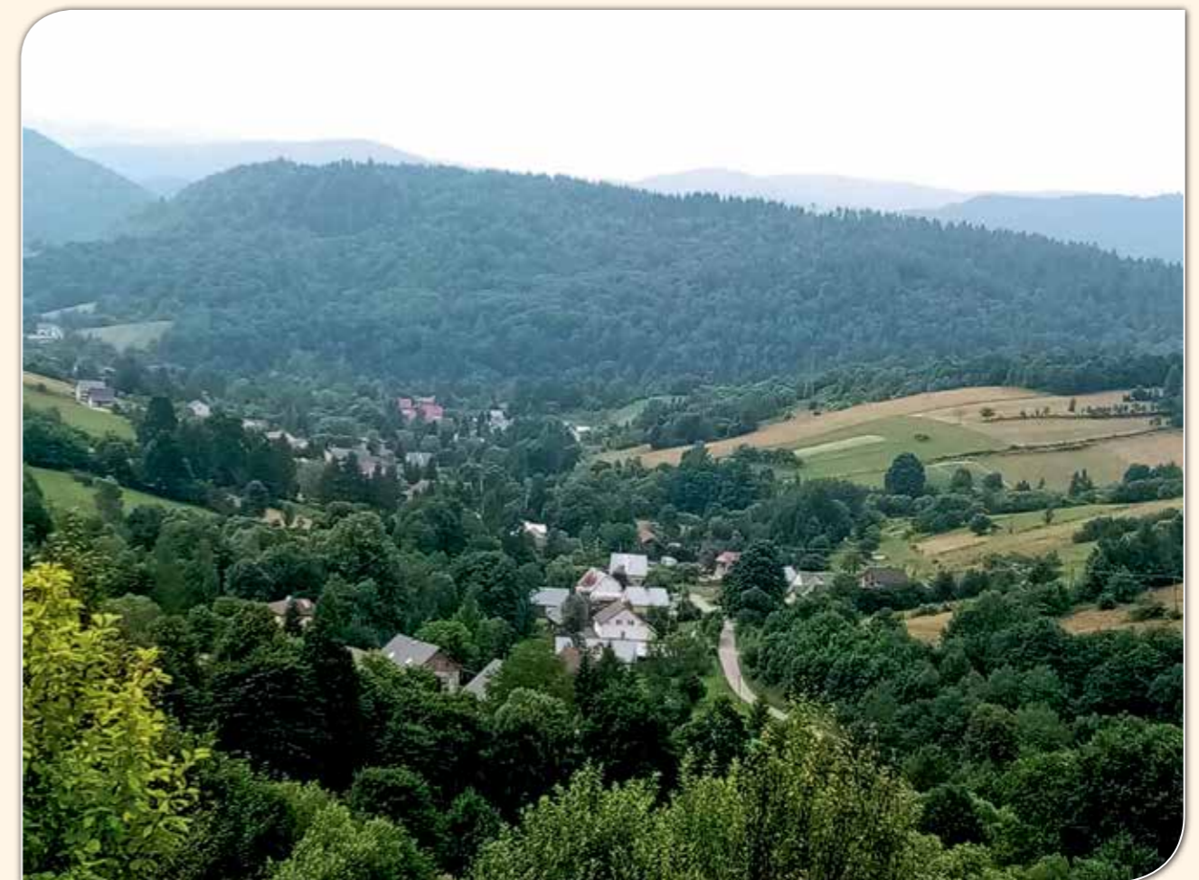
Widok na wioskę Rybne.

Rybne to niewielka, urokliwa wioska w Gminie Solina, w której rodzą się talenty kulinarne. Co prawda nie ma zorganizowanego koła gospodyń, ale to nie przeszkadza, by gospodynie zdobywały nagrody w prestiżowych konkursach kulinarnych, takich jak „Nasze Kulinarne Dziedzictwo – Smaki Regionów” czy też „Podkarpackie Smaki Myśliwskie”.