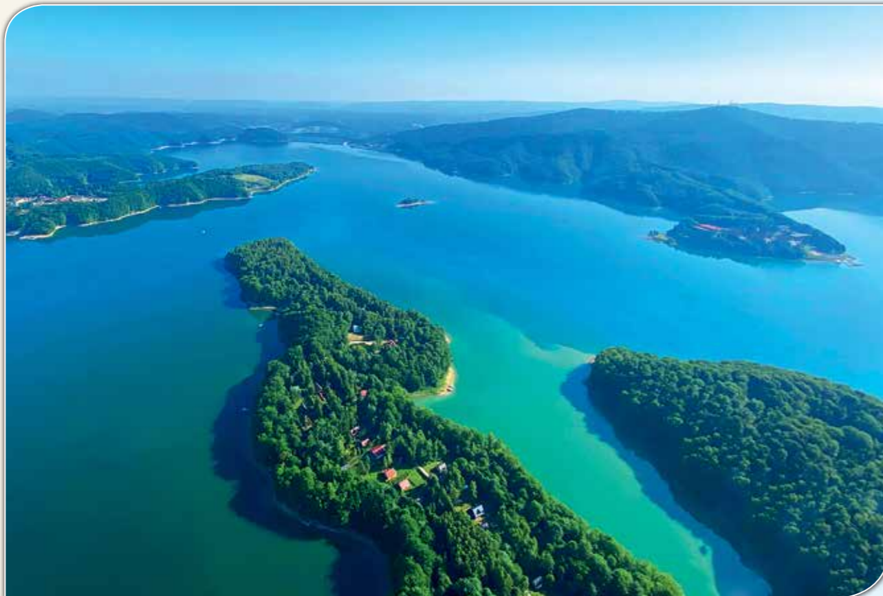
Widok na półwysep Werlas (na pierwszym planie).