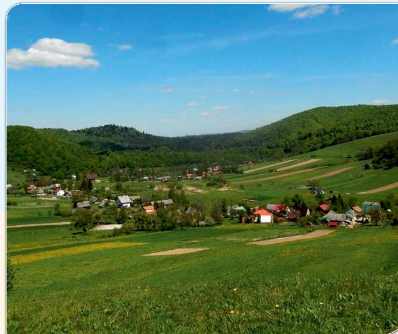
Widok na miejscowość Terka.