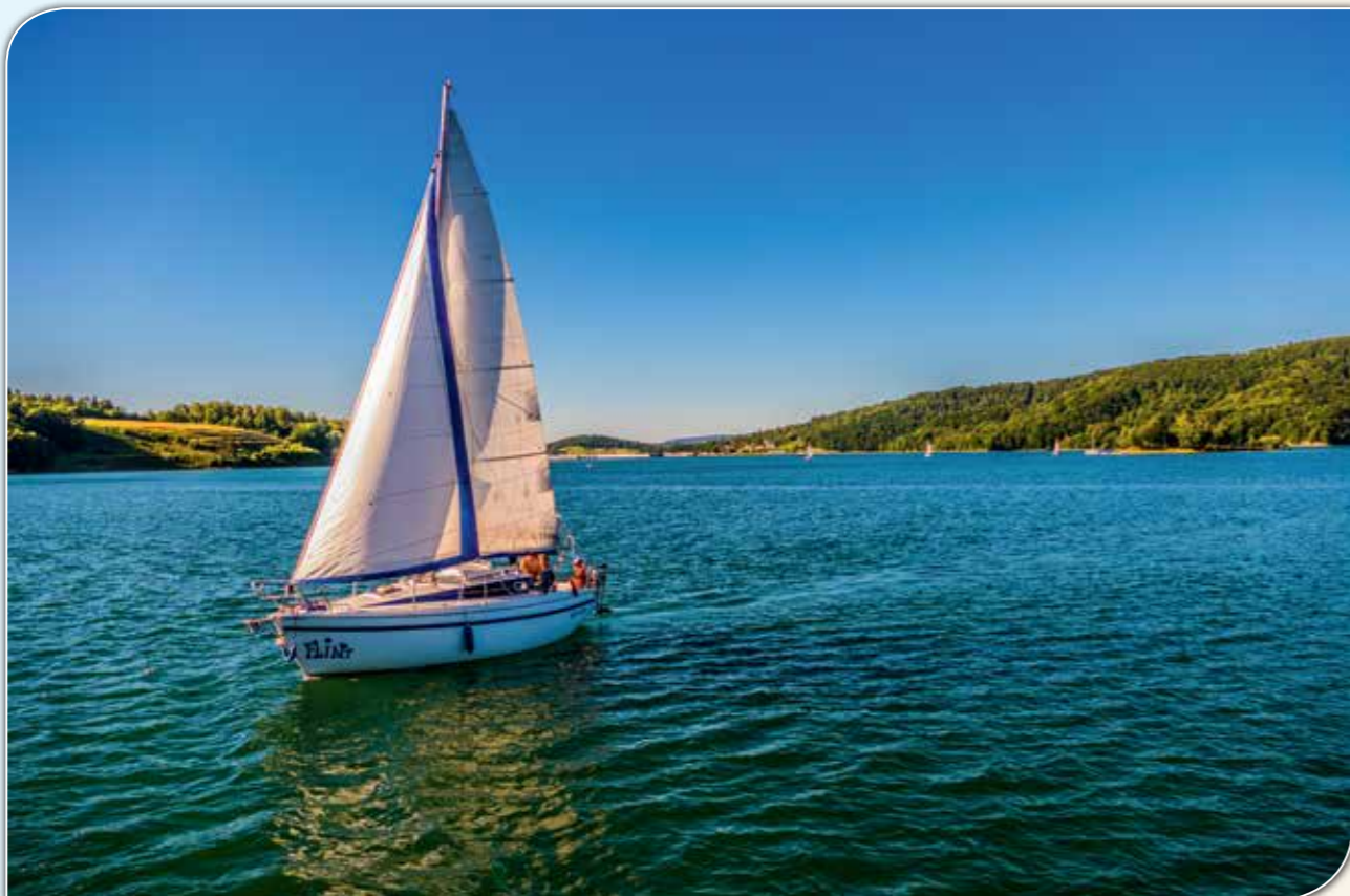
Jezioro Solińskie.