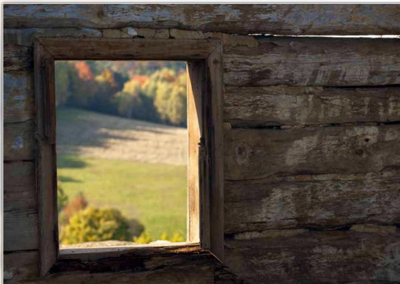
Pozostałości bojkowskiej chyży w Bereźnicy Wyżnej. Tylko widoki pozostają niezmiennie.

Pisząc o dziedzictwie kulturowym Bieszczadów, nie sposób nie zacząć od najważniejszego obiektu w regionie, czyli Gminnego Muzeum Kultury Duchowej i Materialnej Bojków w Myczkowie. Muzeum prezentuje kulturową różnorodność Bieszczadów, gromadzi przedmioty związane z dawnym życiem okolicznych wsi, dworów oraz miasteczek. Utrwala wiedzę na temat zwyczajów, obrzędów, tradycji i codziennej pracy ludzi minionej epoki. Szczególnie zaś stara się zachować pamięć o Bojkach, dawnych mieszkańcach Bieszczadów, którzy od przeszło pięciu stuleci wzbogacali barwny krajobraz etniczny tych ziem, a których historia została przerwana w połowie XX w. Po bieszczadzkich wioskach pozostały tylko nieliczne ślady ich bytności i zacierające się już wspomnienia.