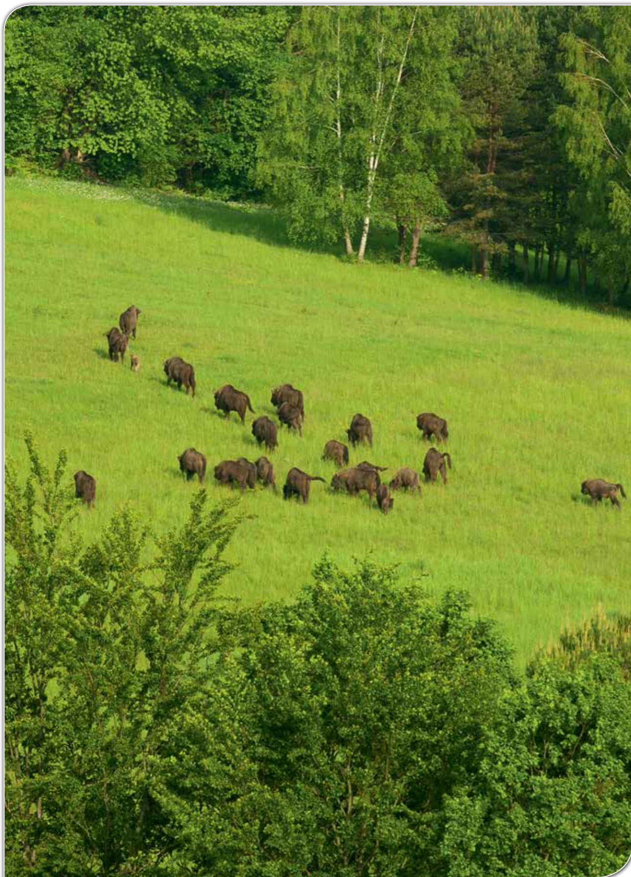
Mieszkańcy bieszczadzkich lasów. Stado żubrów pasących się pod lasem w Bereźnicy Wyżnej.