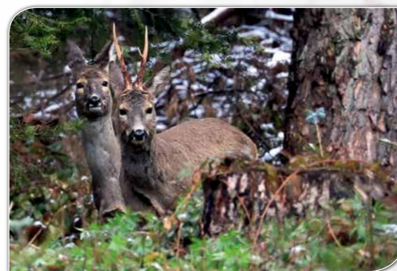
Mieszkańcy bieszczadzkich lasów.