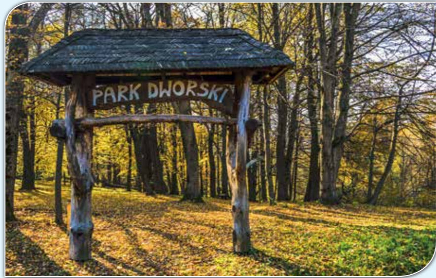
Park dworski, Berezka.