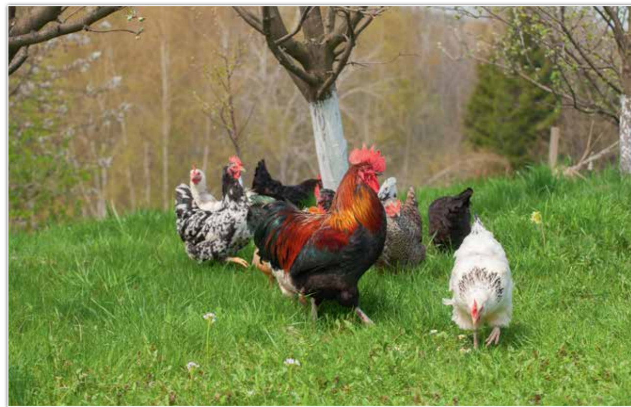
Będą potrawy z jajkami od szczęśliwych kur, Bereźnica Wyzna.