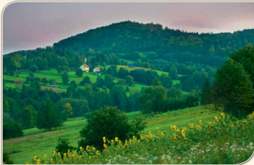
Letnisko Bereźnica Wyżna, ostoja ciszy i spokoju.