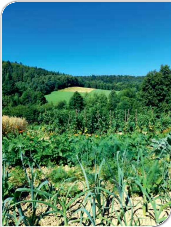
Warzywa z przydomowych grządek, choć nie najpiękniejsze, za to najsmaczniejsze.