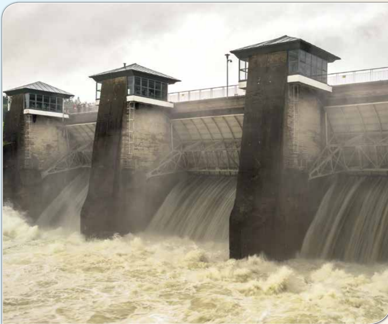
Zapora w Myczkowcach.