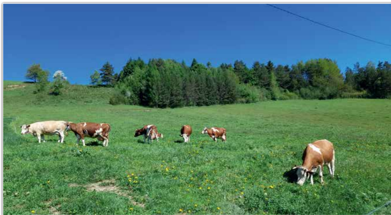
Wypas krow na bieszczadzkim, niczym nieskażonym pastwisku, Wola Matiaszowa.

Bieszczady to bogactwo fauny i flory, czysta woda oraz powietrze dające specyficzny klimat. Dobre, zdrowe jedzenie, a także walory krajobrazowe i liczne zasoby kulturowe. Wszystko to sprawia, Drogi Czytelniku, że musisz razem z nami ZASMAKOWAĆ BIESZCZADÓW.