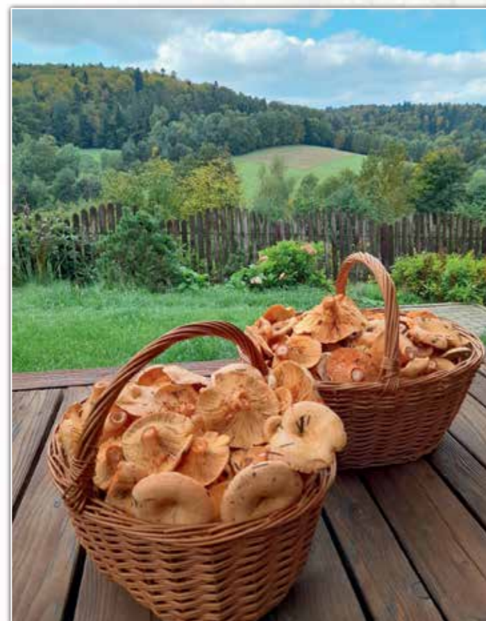
Rudy, rudy rydz...