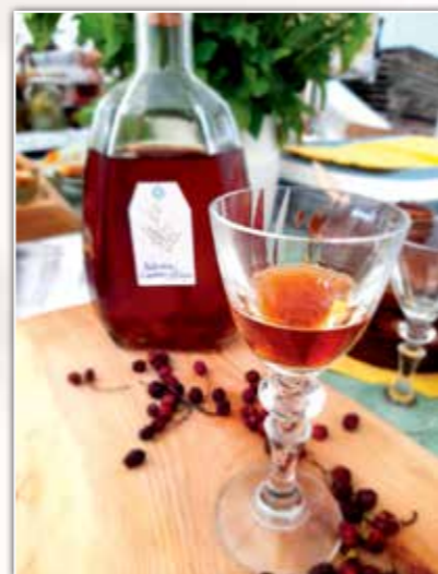
Nalewka z głogu. Targi Turystyki, Leśnictwa i Produktu Lokalnego Agrobieszczady 2021.