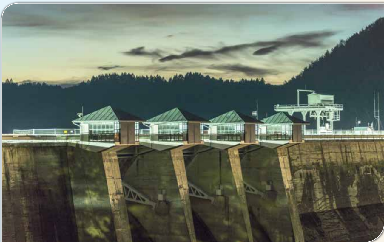
Zapora w Solinie.