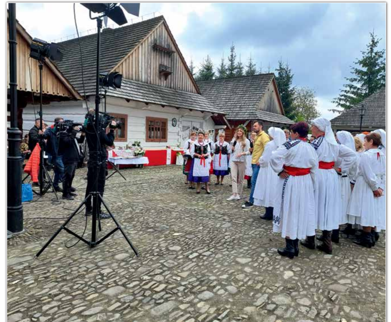
Festiwal KGW „Polska od kuchni” na Galicyjskim Rynku w Muzeum Budownictwa Ludowego w Sanoku, 2021 r.

Działające w Gminie Solina Koła Gospodyń Wiejskich, jak również indywidualne gospodynie prowadzące gospodarstwa agroturystyczne oraz zagrody edukacyjne zdobywają nagrody w prestiżowych konkursach kulinarnych, takich jak Nasze Kulinarne Dziedzictwo – Smaki Regionów, Targi żywności tradycyjnej – Festiwal Podkarpackich Smaków w Górnem czy też Targi Turystyki, Leśnictwa i Produktu Lokalnego – Agrobieszczady odbywające się w Lesku.