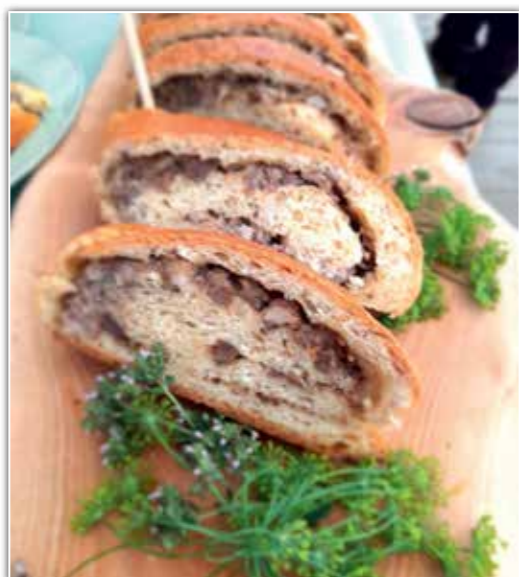
Zawijaniec z horbu. Targi Turystyki, Leśnictwa i Produktu Lokalnego Agrobieszczady 2021.

Drożdżowy, wytrawny placek zwinięty w rulon z dużą ilością farszu z dziczyzny, lekko pikantny i aromatyczny.