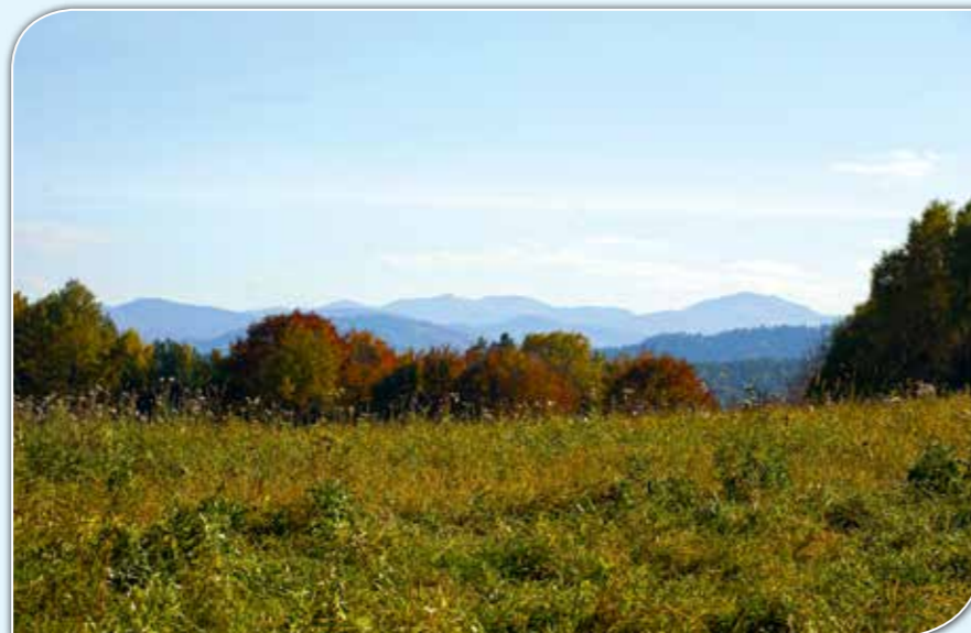
Widok z Bereźnicy Wyżnej na połoniny.