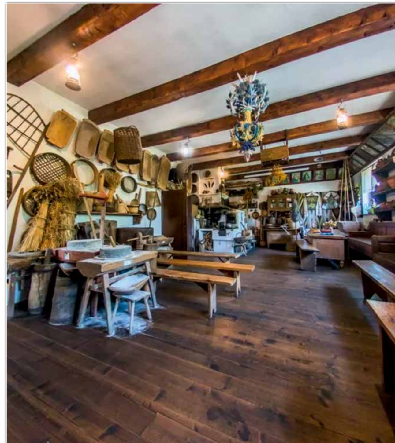
Ekspozycja w Gminnym Muzeum Kultury Duchowej i Materialnej Bojków w Myczkowie.

Wśród zachowanych eksponatów w Muzeum znajdują się dawne sprzęty rolnicze i domowe, wyroby rzemiosła ludowego, meble, naczynia i tradycyjne tkaniny. Są to głównie wyroby rękodzielnicze, które świadczą o kunszcie, umiejętnościach i wykorzystaniu środowiska naturalnego do zaspokojenia potrzeb bytowych i estetycznych dawnych mieszkańców wsi. Eksponaty pochodzą z okresu od końca XIX w. do połowy XX w.